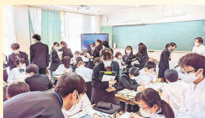
教員志望の鉾田一高生が付属中の授業の見学および授業担当(たんとう)者の手伝いを体験=2020年10月20日