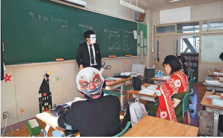
鉾一ハロウィーンデーは仮装して通常の学校生活を送る=2021年10月28日