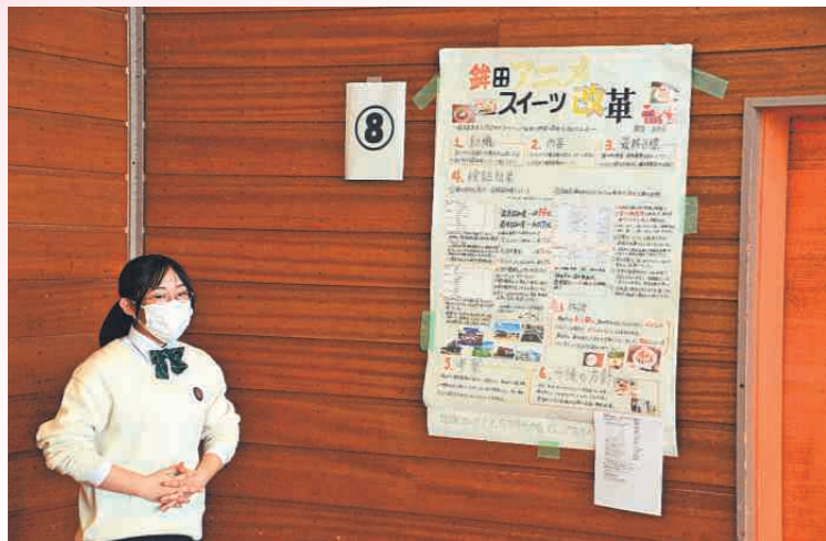
探究学習の発表をする付属中2年生=2022年5月20日