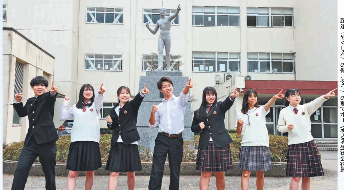
躍進(やくしん)の像(しるし)の前のホーンを吹く生徒役員